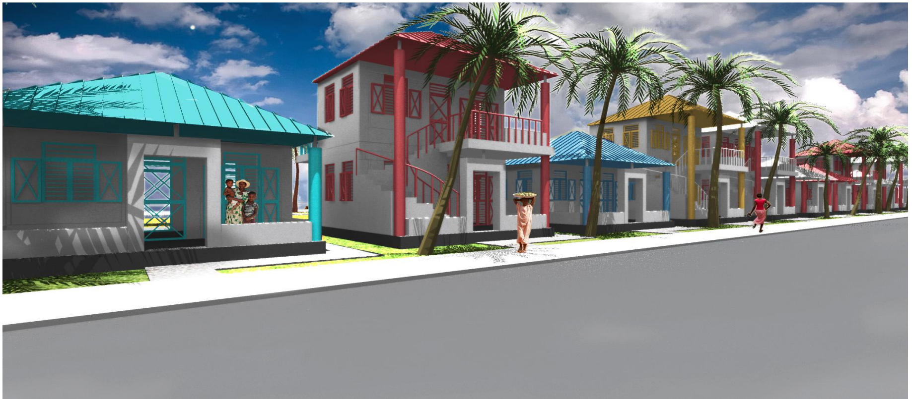
Vue d'artiste du projet EPPLS à Duvivier